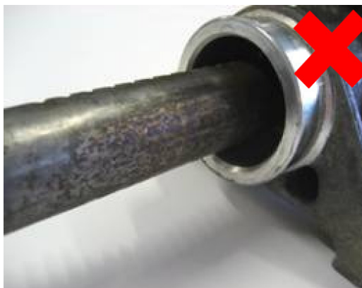
Efect negativ din scurgerea uleiului (ruginirea cassettei de direcție)