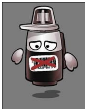
Absența piesei de pe lista de recuperare