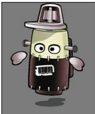
Piesă ce a suferit modificări / adaptări