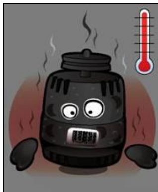
Piesă arsă sau ruginită excesiv