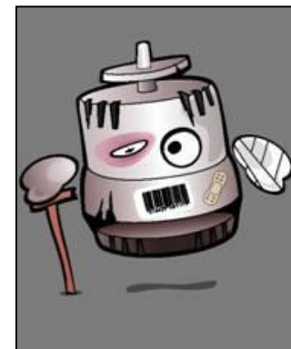
Piese lipsă sau deteriorate in componența piesei vechi